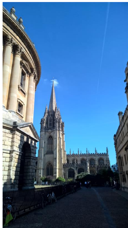
University Church of St Mary