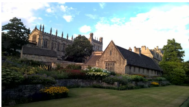
Christ Church College