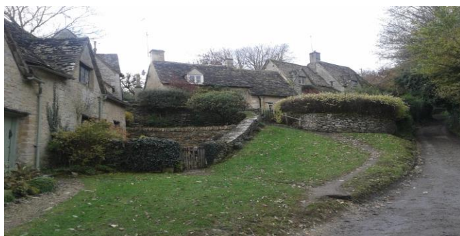
Burford w Cotswolds