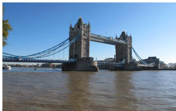
Tower Bridge w Londynie