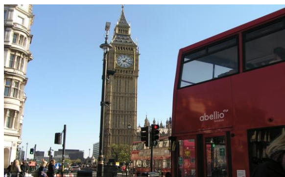
Big Ben w Londynie