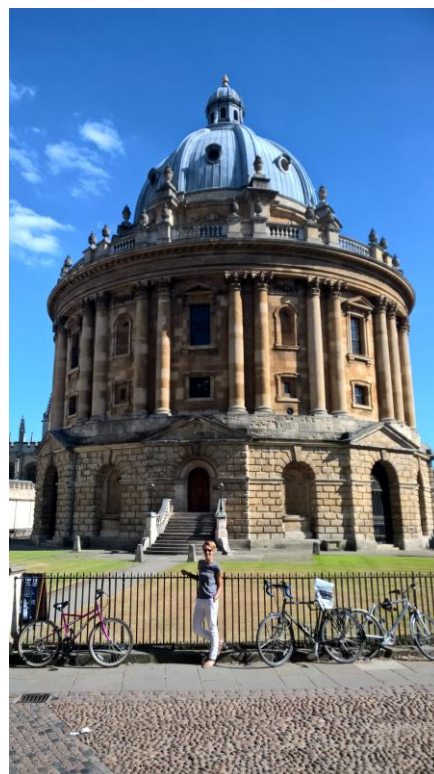
Radcliffe Camera, czytelnia Biblioteki Bodlejańskiej