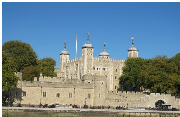
Tower of London