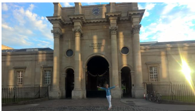
Oxford University Press

Ogromną zaletą kursu było zakwaterowanie w centrum Oxfordu, co dawało okazję do codziennych spacerów ulicami historycznego miasta. Możliwość codziennego kontaktu z językiem miała ogromny wpływ na poprawę kompetencji językowo-komunikacyjnych, jak również na lepsze poznanie i zrozumienie zwyczajów panujących w kraju.