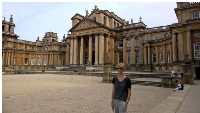
Pałac w Blenheim

Program zaproponowany przez szkołę językową The Lake School of English był bogaty w zajęcia z wiedzy kulturoznawczej, geograficznej oraz historycznej dotyczącej Wielkiej Brytanii. Szkoła zorganizowała dla uczestników kursu pieszą wycieczkę po Oxfordzie oraz kilka bardzo atrakcyjnych wycieczek autokarowych m.in. do Londynu, Brighton, Cotswolds czy pobliskiego Blenheim Palace.