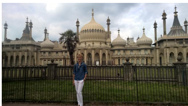
Royal Pavilion w Brighton