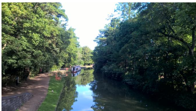
Houseboats na Tamizie