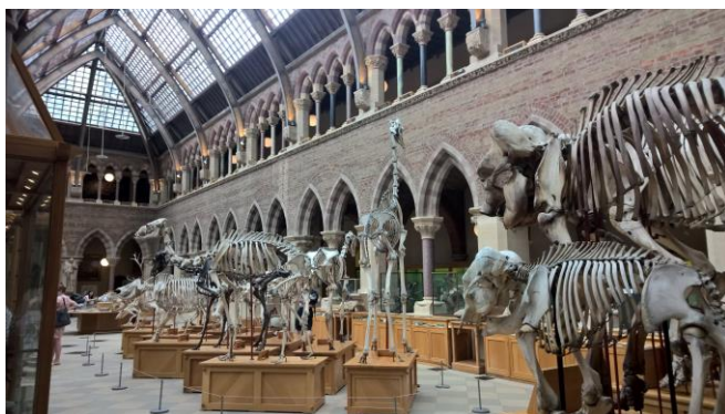
Pitt Rivers Museum