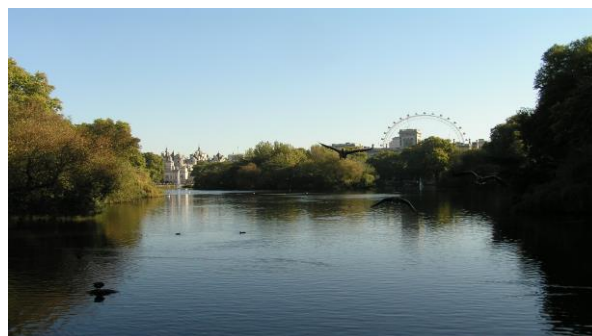
St James's Park w Londynie