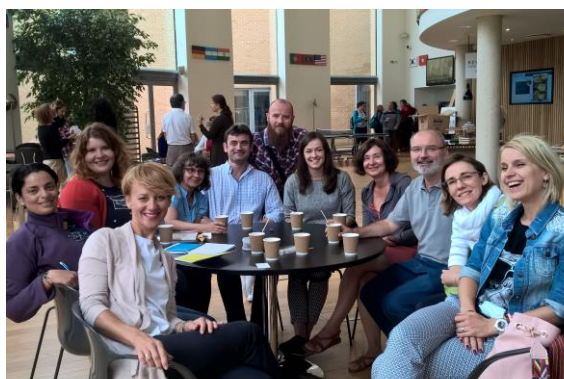
Podczas zajęć w The Lake School of English